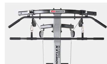
Columna lateral con barra lateral en ángulo