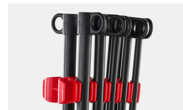
Resistencia Power Rod®